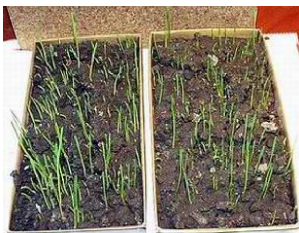
use of the processed water - use of standard water