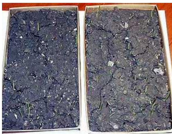
use of the processed water - use of standard water