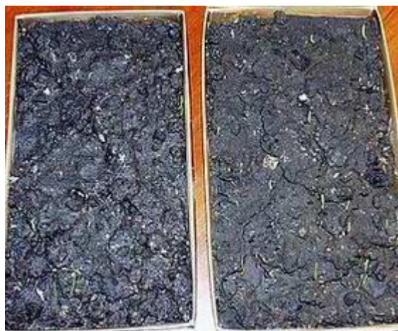
use of the processed water - use of standard water