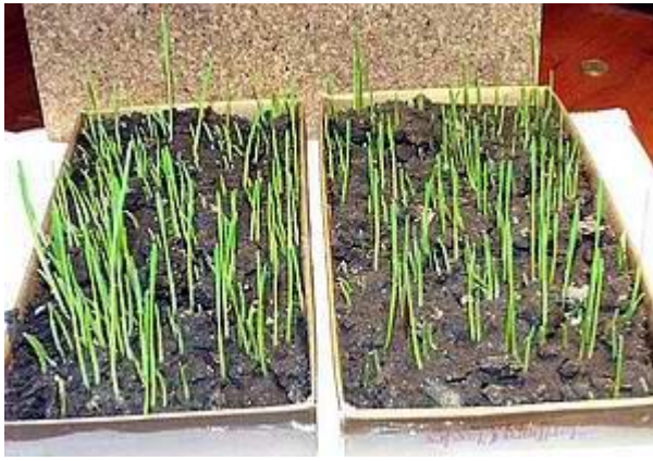
use of the processed water - use of standard water