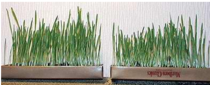
use of the processed water - use of standard water