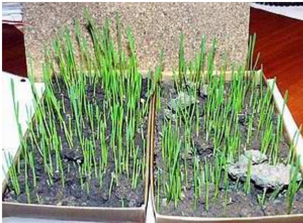
use of the processed water - use of standard water